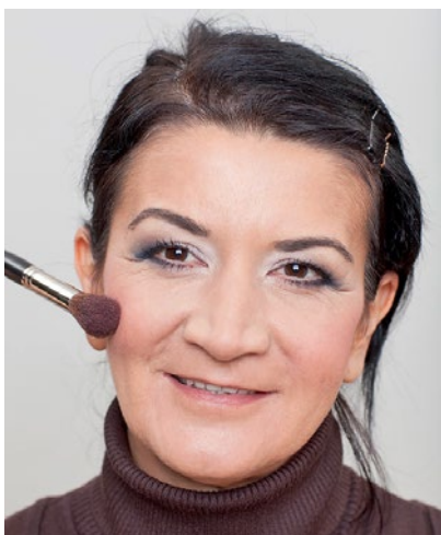
Bei einem müden, fahlen Teint kann ein Rouge in Pink Abhilfe schaffen.

Die Auswahl der Lippenfarbe ist so individuell wie die Kundin selbst. Bei trockenen Lippen sehen cremige Lippenstifte am besten aus. Pearleffekt würde jede einzelne Unebenheit auf den Lippen noch betonen. Auch eine sehr schöne Technik ist es, die Lippen mit einem Lipliner zu umranden , diesen zur Lippenmitte hin abzusoften und einen Pflegestift darüberzugeben. Bei herabhängenden Mundwinkeln sollte man den Bereich in den Winkeln gut mit Concealer aufhellen und den Lipliner oder Lippenstift nicht bis in die Mundwinkel ziehen. Bei unschönen Lippenfältchen am oberen Lippenrand empfiehlt es sich, einen hautfarbenen Liner oder hellen Concealer um die Linien zu ziehen und sanft zu verblenden. Keine zu intensiven Farben für das Lippen-Make-up verwenden. □